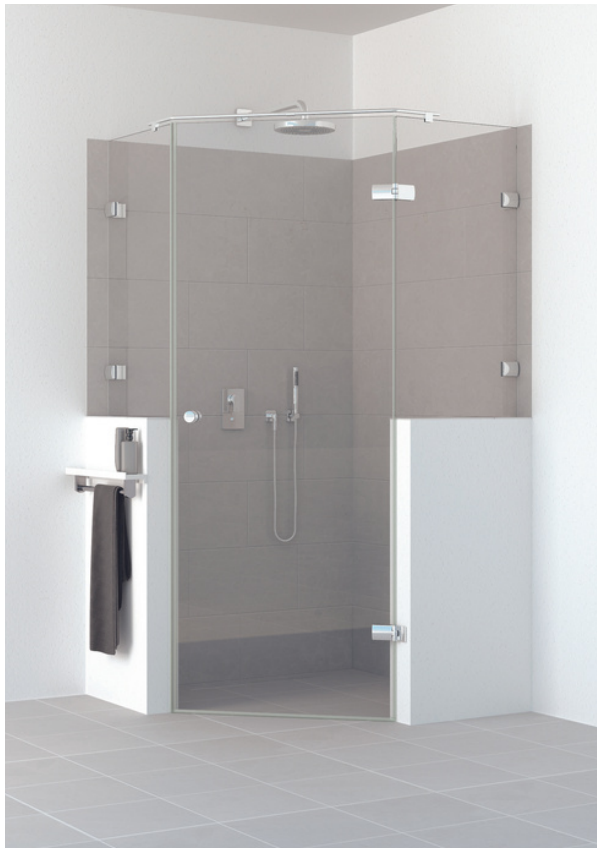
BO 410 TYPE 255 W

This system caters for the most sophisticated design requirements: pentagonal showers form part of the standard scope of supply.